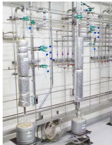
研究・開発用蒸留設備