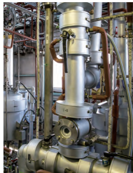
中・小型蒸留設備